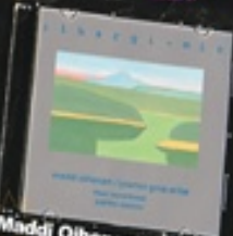
Maddi Oihenart/Josetxo Goia ihargi-min