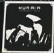
Kurala Iuntasunari barre