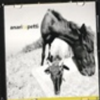
Anari ta Petti