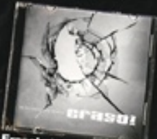
Erasol gisez bustitako egunak